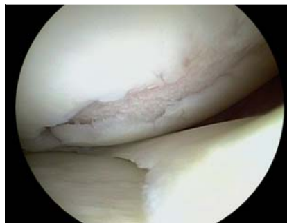
Abb. 1 Der isolierte Knorpelschaden III. und IV. Grades nach ICRS-Klassifikation bei intakter korrespondierender Gelenkfläche, sowie intaktem Umgebungsknorpel stellt die geeignete Indikation zur ACT dar.

Aus Sicht der Autoren ist die Abrasionsarthroplastik [25,26] nicht als knochenmarkstimulierendes Verfahren zur Behandlung von isolierten Knorpelschäden etabliert und wird eher im Rahmen der Arthrosetherapie eingesetzt. Auf Basis der verfügbaren Literatur stellt die arthroskopische Mikrofrakturierung das Verfahren mit der besten Evidenzlage innerhalb der knochenmarkstimulierenden Therapien dar, weshalb im Folgenden auf diese Methode eingegangen werden soll.