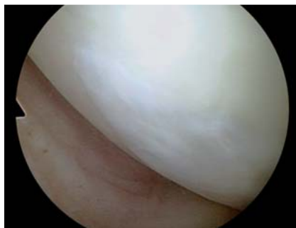
Abb. 2 Arthroskopischer Befund 24 Monate nach ACT im Bereich der medialen Femurkondyle mit Nachweis eines gut integrierten Regeneratknorpels.

ACT im Vergleich zur Mikrofrakturierung oder OCT um eine Methode mit höheren verfahrensassozierten Kosten handelt. Außerdem ist die ACT auch für den Patienten ein aufwendigeres Verfahren, da es sich durch die Biopsie zur Zellgewinnung und der zu einem späteren Zeitpunkt durchgeführten Replantation der Zellen um ein 2-zeitiges Verfahren, also um 2 operative Eingriffe handelt.